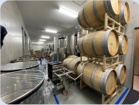
↑地下工場の醸造樽!