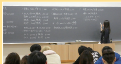
お気軽にお問い合わせください。